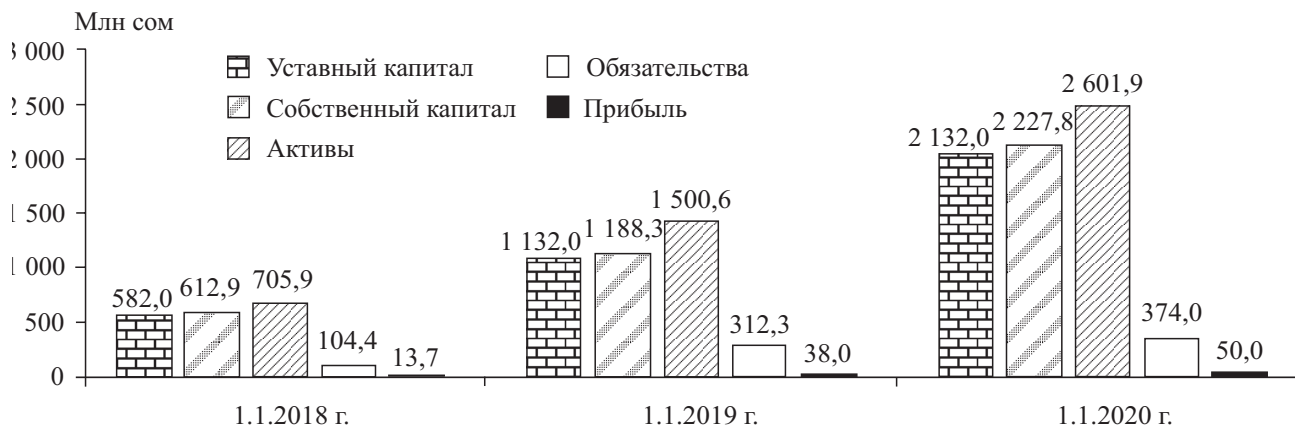
Рис. 1. Показатели деятельности ОАО «Гарантийный фонд», млн сом