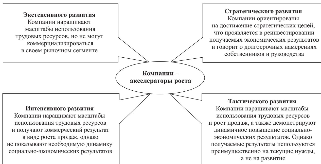
Рис. 2. Классификация компаний – акселераторов роста

принятия мер по повышению производительности труда. Компании тактического развития не обеспечивают прирост чистых активов, что свидетельствует об ограниченности инвестиционной активности и, возможно, требует принятия мер по расширению доступа к источникам финансирования. Компании стратегического развития имеют тенденцию к снижению средней численности, что может быть вызвано необходимостью освоения новых рынков сбыта и расширения экспортного потенциала региона.