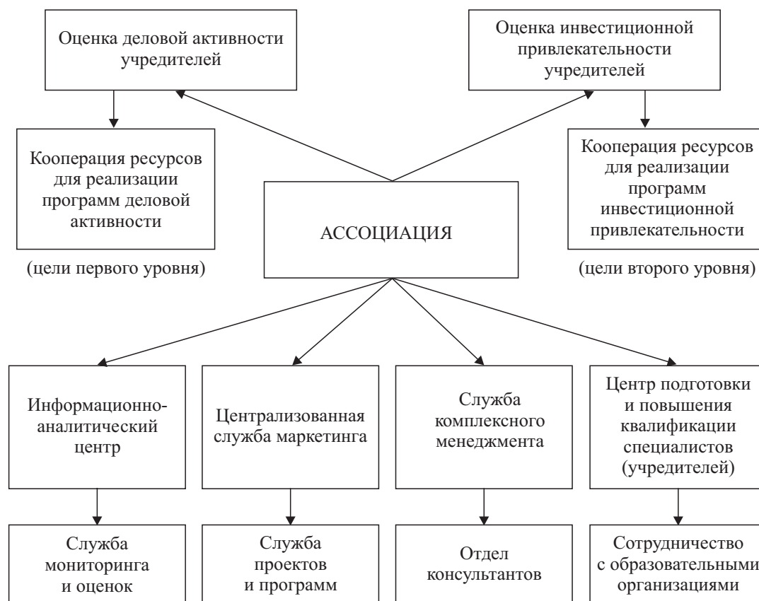
Рис. 3. Структура, цели и задачи ассоциации

– цели второго уровня – обеспечение реализации программ социально-экономического развития отраслей и региона с использованием их инновационных потенциалов.